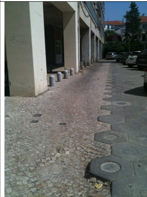
Único prédio com pavimento original, completado com calçada - Exemplo a replicar