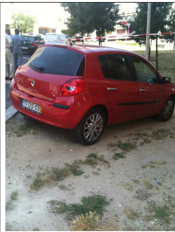
Estacionamento em cima das zonas verdes -