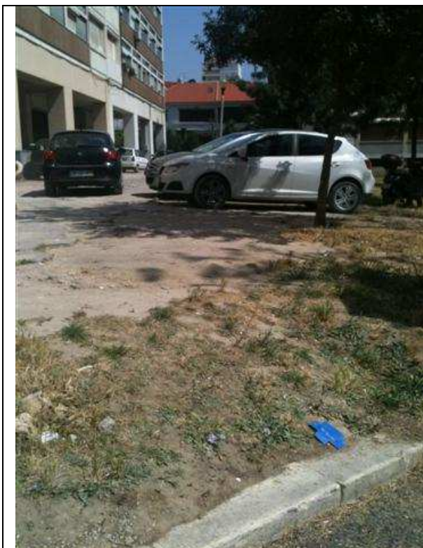
Estacionamento em cima das zonas verdes -