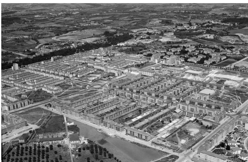
Foto 46: PT/AMLSB/ABR/I00027 - Fotografia aérea do bairro de Alvalade - [1953] - Nunes, Alberto Augusto