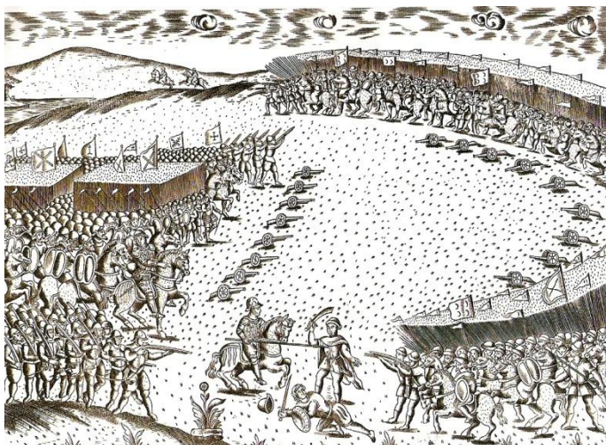
Miguel Leitão de Andrade (1629) - Batalha de Alcácer-Quibir (1578), Museu do Forte da Ponta da Bandeira, Lagos,

O Campo Grande foi o local escolhido por D. Sebastião para exercícios militares das forças que haviam de o acompanhar na jornada a África, em 1578, e que acabaria por resultar na Batalha de Alcácer-Quibir.