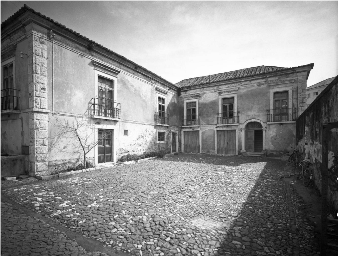
Foto 48: PT/AMLSB/SER/S01661 - Palácio dos Coruchéus - [1963] - Serôdio, Armando

Entre os séculos XVI e XVIII, nos Campos de Alvalade foram construídas quintas, palácios e palacetes, para os momentos de veraneio da nobreza.