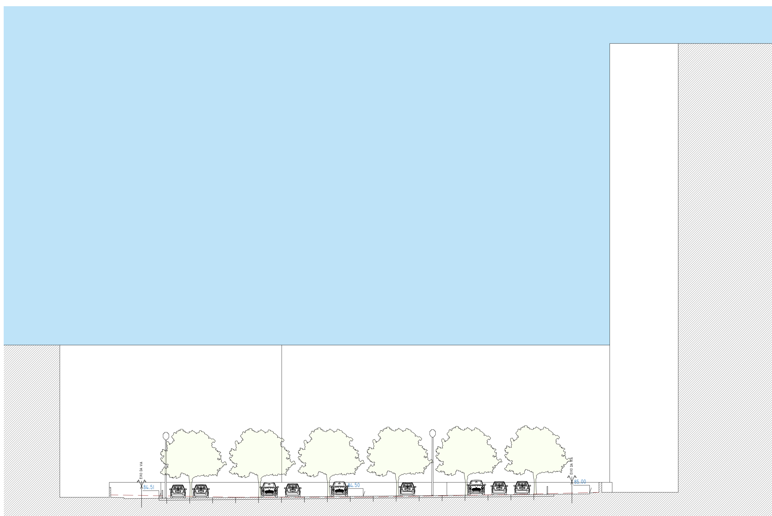
CORTE | C2