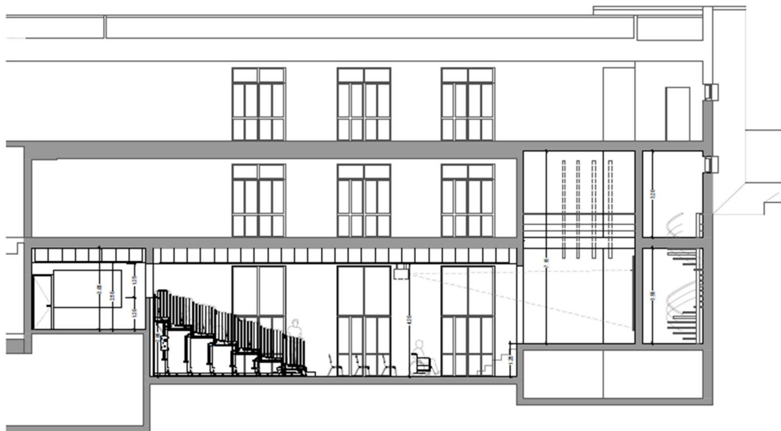
CORTE C1 Auditório - Balcada aberta