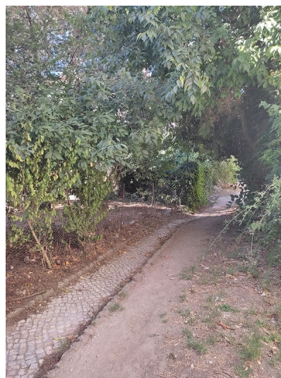
Fotografias 2 a 5 – Vegetação existente no caminho.