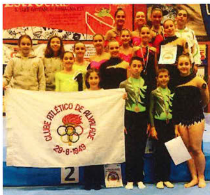
Figura 1 – Participação no evento, em 2016

A classe de Ginástica Acrobática do Clube Atlético de Alvalade é uma das participantes inaugurais deste evento, tendo participações regulares ao longo das diversas edições, contribuindo para elevar o nome do clube e da freguesia a nível internacional.