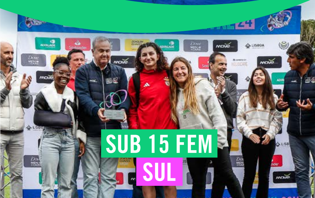
SUB 15 FEM