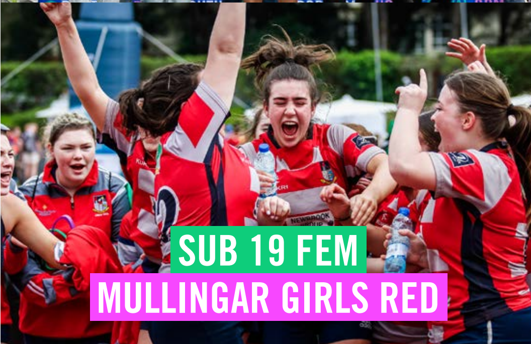
SUB 19 FEM