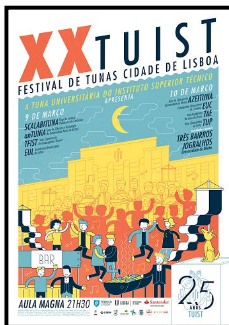
Cartaz do I Festival da TUIST a 20 de Março de 1993 e do XX TUIST a 9 e 10 de Março de 2018