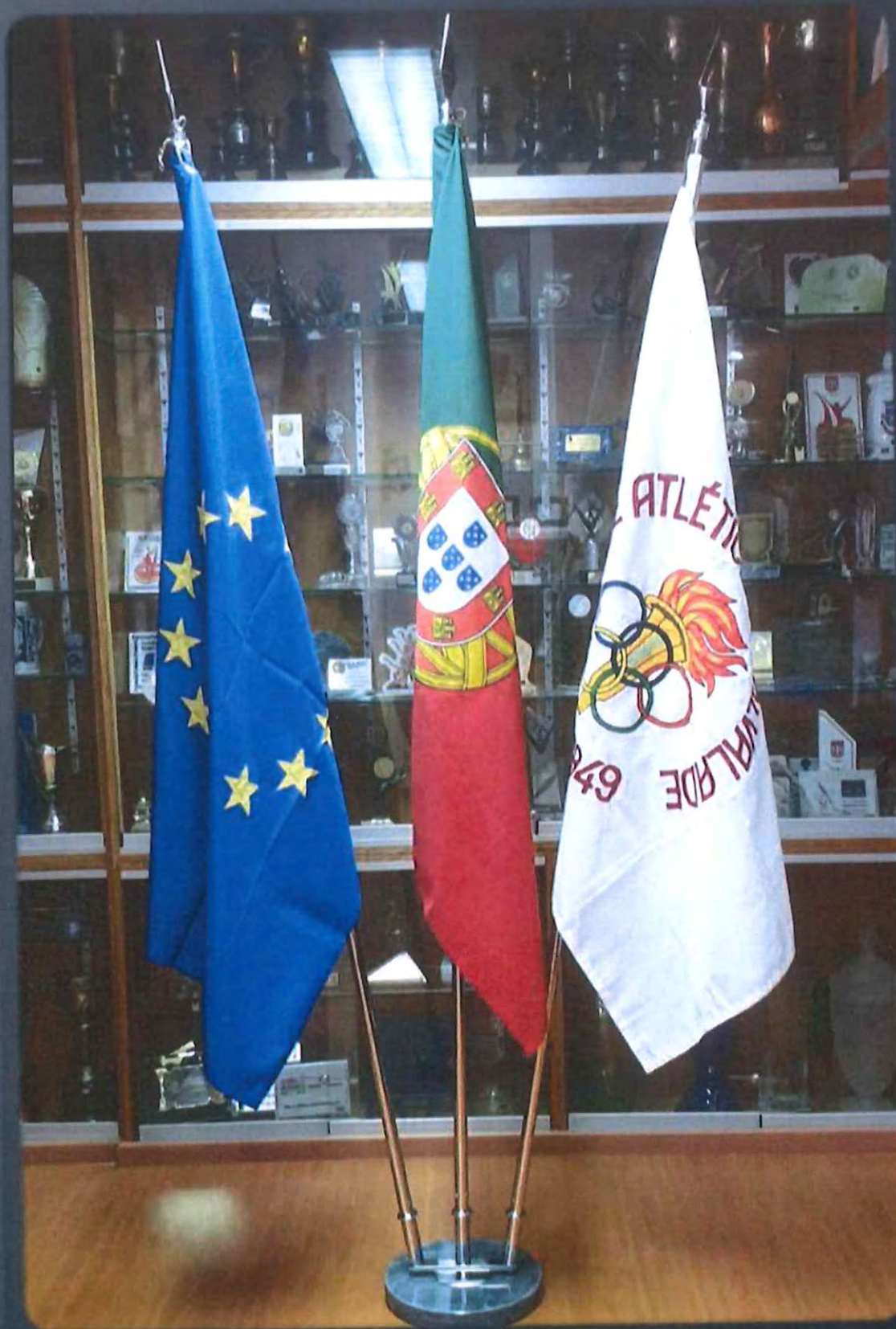
Clube Atlético de Alvalade Pedido Apoio - Setembro 2021